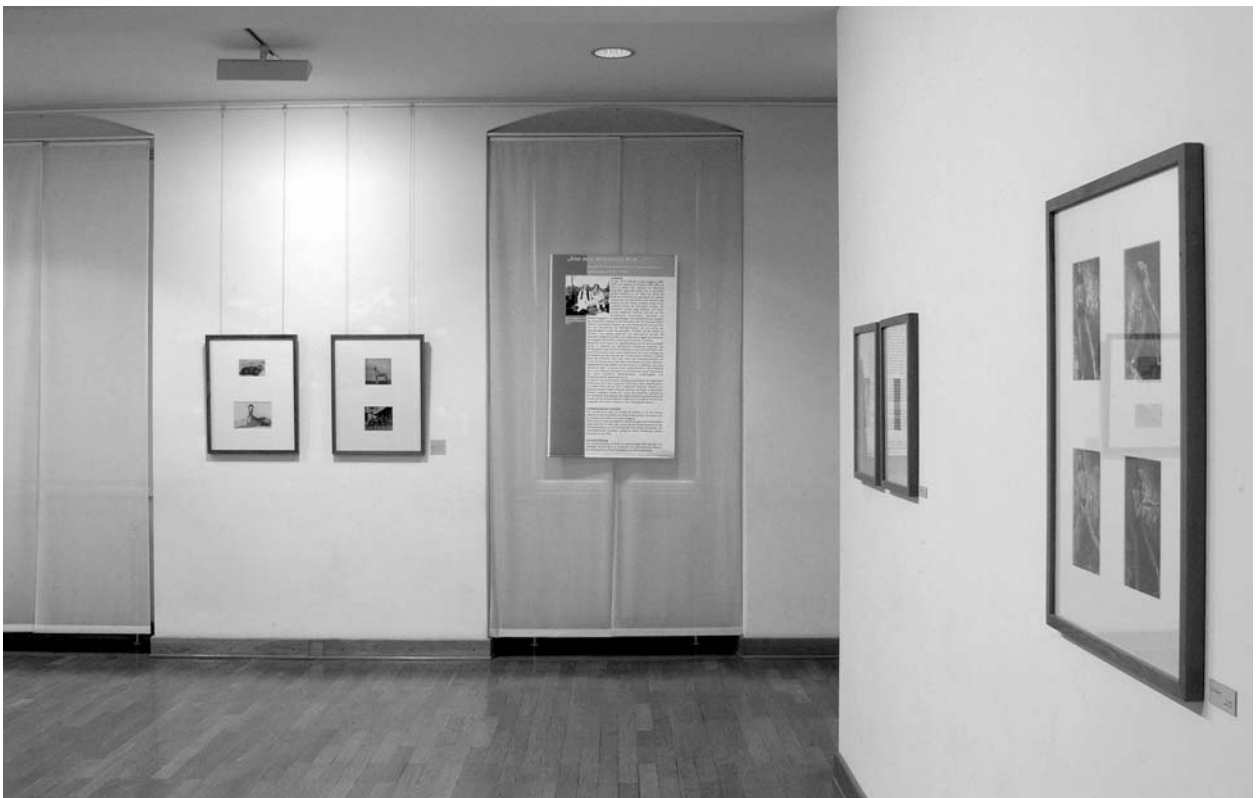
Fotografien von Hunden aus dem bekannten Zwinger Loheland, rechts Fotos der Tänzerinnen