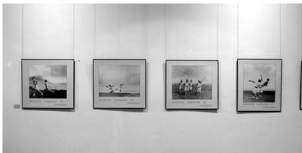
Objekte aus den Werkstätten oben und Großformate zur Gymnastik unten