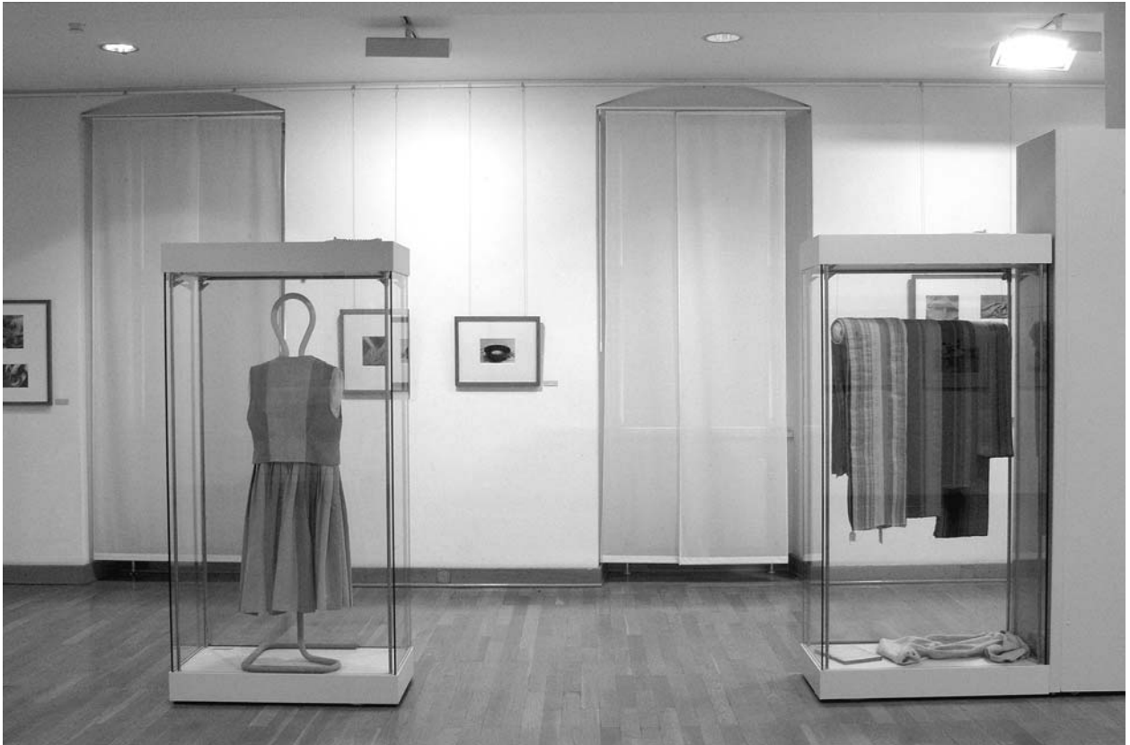
Vitrinen mit Kleid sowie Seidenbrokaten aus der Loheland-Handweberei