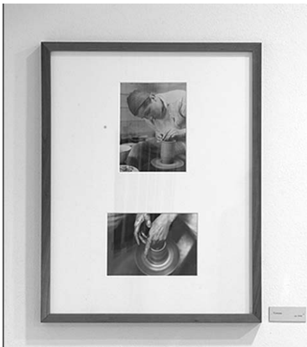
Fotografien aus der Töpferei

Angesichts der Tatsache, dass ein Stempel auf Bildern in der Regel auf professionell betriebene Fotografie verweist, und der Preis der in Berlin angebotenen Arbeiten sofort erkennen ließ, dass auch der Markt ihren Wert erkannt hatte, war der Weg nach Loheland kurz.