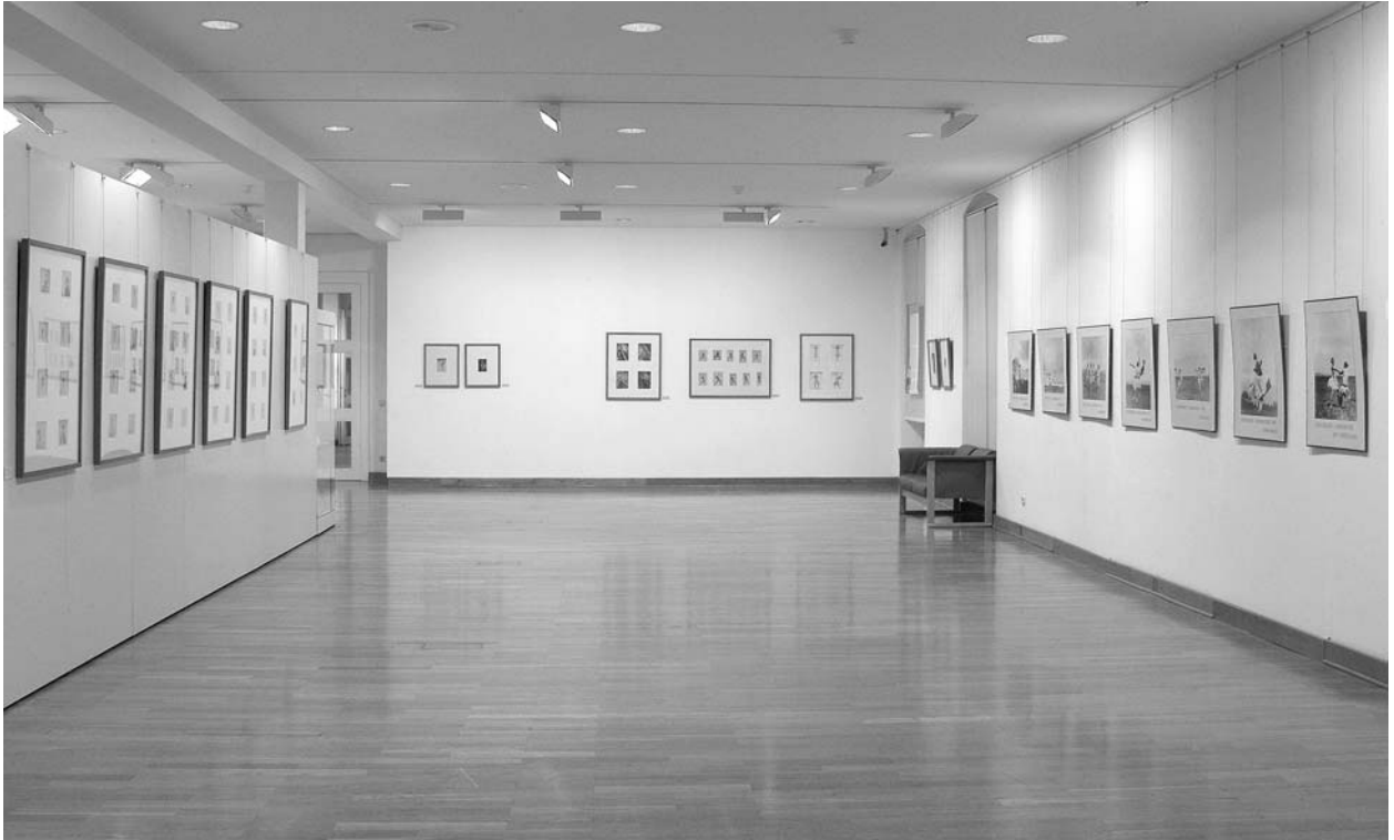
linker Hand Porträts, geradeaus Tänzerinnen, rechts großformatige Gymnastikbilder