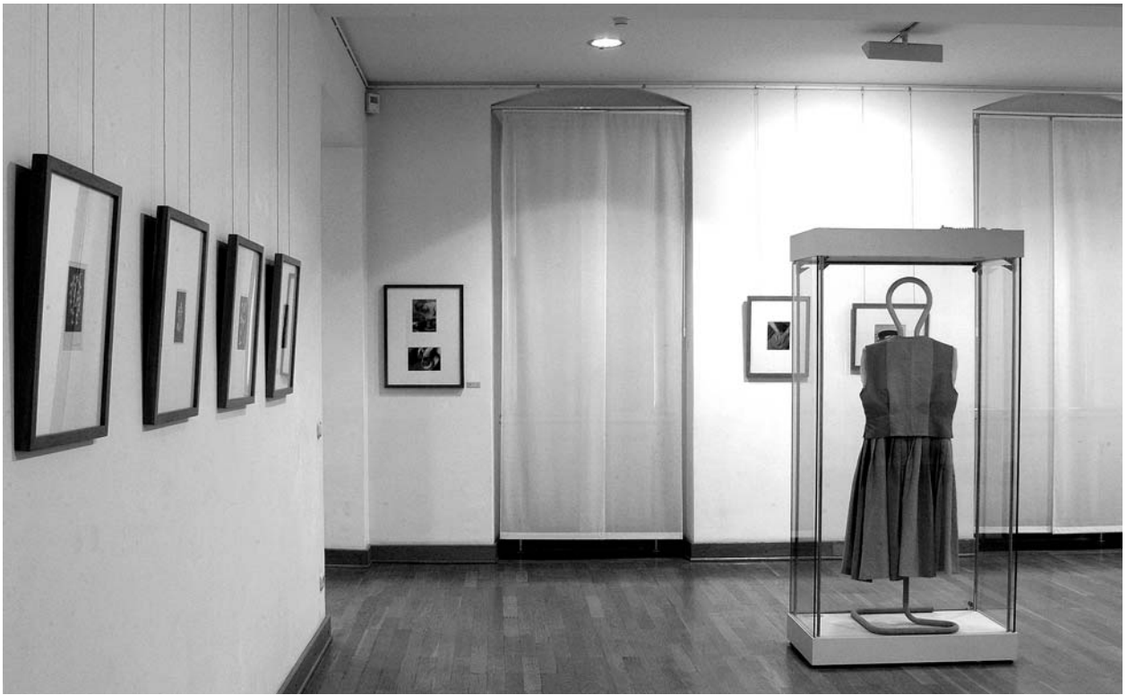
Blick von den Fotogram- men linker Hand zu Objektfoto- grafien