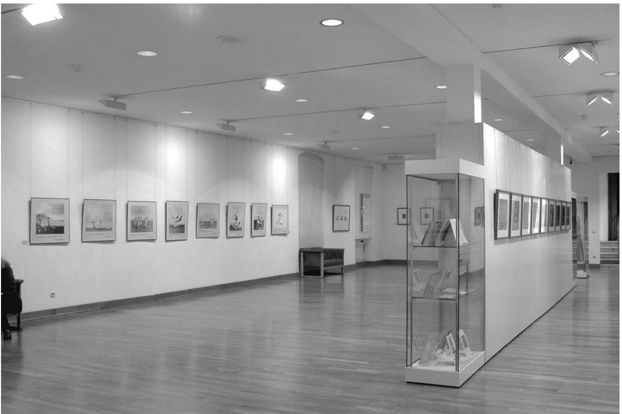
Großforma- tige Fotogra- fien zur Gymnastik links; vorne Vitrine mit Literatur