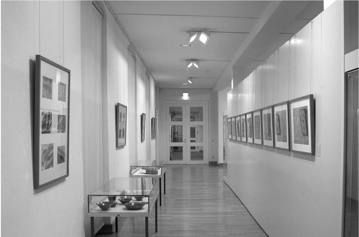
Fotografien aus der Anbauforschung sowie Vitrinen mit Objekten aus den Werkstätten *

* Die Fotografien dieser Ausstellungsdocumentation sollen dem Betrachter einen Eindruck der Präsentation der Werke in der Ausstellung vermitteln. Interessierte an den Fotografien der Lichtbildwerkstatt selbst oder an Arbeiten von Bertha Günther werden auf den auf der letzten Seite genannten Ausstellungskatalog des Vonderau-Museums Fulda verwiesen, der Reproduktionen vieler Arbeiten zeigt.