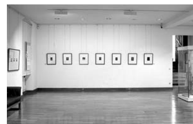
Blick auf die Fotogramme