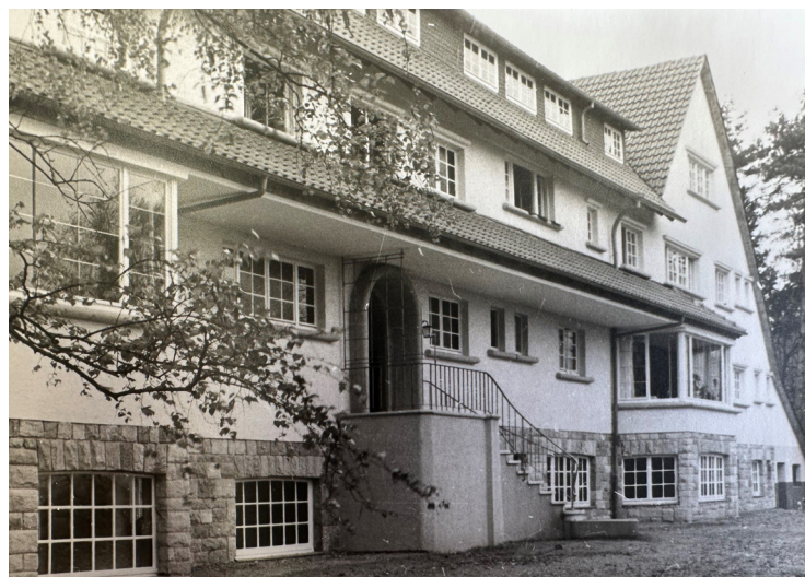
Wiesenhaus Ende der 50er Jahre